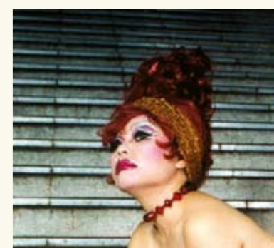
Gestaltung: K. Marie Walter, Titel unter Verwendung eines Motivs von Jean-Ulrick Désert